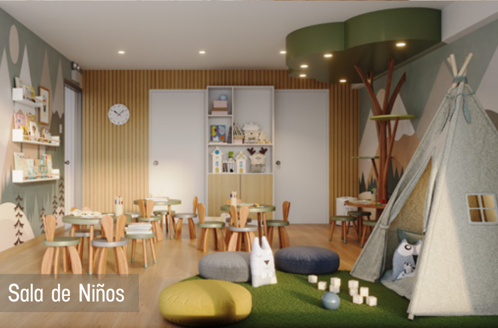
Sala de Niños